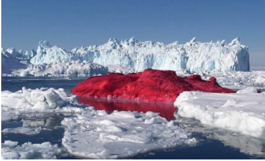
Görsel 2. Marco Evarissti, “Ice Cube Project”, 2004, buz ve 3000 litre kan kırmızısı boya, Grönland.

Çevre sanatı, üretim sürecinde kullanılan malzemeler, sergilendiği alanlar itibarıyla hep bir ideolojik mesaj iletmek ister. “Sanatçılar eliyle doğanın farkındalığına varılması, hatta korkunç bir hızla gelişen teknoloji karşısına doğayı kutsayan, doğanın ve doğaya dair olanın görünür kılınması, ona ilişkin bilinç uyandırılması Çevreci sanatın kavramsal çıkış noktası olarak görülebilmektedir” (Antmen, 2014: 251).