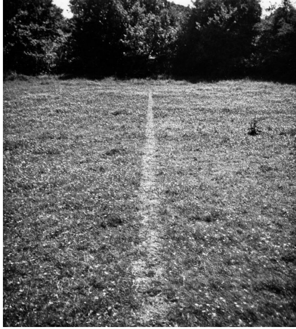
Görsel 6. Richard Long, Yürüyerek Yapılmış Çizgi , 1967, İngiltere.

Çevreci Sanat adı altında en önemli isimlerden Christo ve eşi Jeanne Claude 1960 lardan beri gerçekleştirdikleri dev eserler ile çevrelerini etkilemiş, insan algısını değiştirmiş dönüştürmüşlerdir. Dünyanın bir çok ülkesinde doğaya olan duyarlılıklarını insanlarla paylaşmak için eserler üretmişlerdir. Bunlardan bir tanesi de göl sularının çekilmesi ve su kirliliği üzerine dikkat çekmek amacı ile yaptıkları The Surrounded Islands çalışmasıdır.