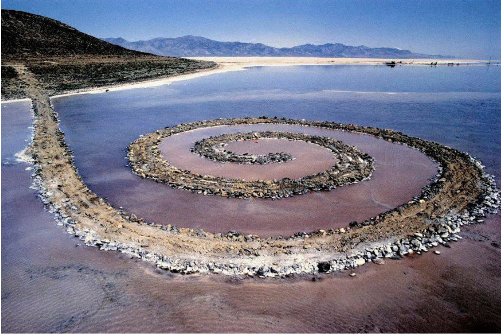
Görsel 1. Robert Smithson, Spiral Dalgakıran , 1970, kireçtaşı, toprak, su, U. 147,2m., G. 4,57m., Büyük Tuz Gölü, Utah.

Robert Smithson, 'Spiral Jetty / Spiral Dalgakıran' isimli çalışmasını petrol çıkarmak için kullanılan bir endüstri alanında 1970 yılında doğadaki yaşam döngüsüne dikkat çekmek için gerçekleştirir. Bu çalışmayla insanın doğa ile olan ilişkisine dikkat çekmek istemiştir. Zamanla spiraller arasındaki su kırmızı renk alır ve tuzun değişimi gözlenir. Kırmızı ölüm anlamına gelmektedir. Smithson' un çalışması ile doğa etkileşime girer. Doğası gereği değişime uğrayan çalışma, sanatçının en çok ilgilendiği konulardan entropiyi yani doğanın aşama aşama yavaşlaması ve son bulmasına ilgi çekmek ister. (Görsel 1)