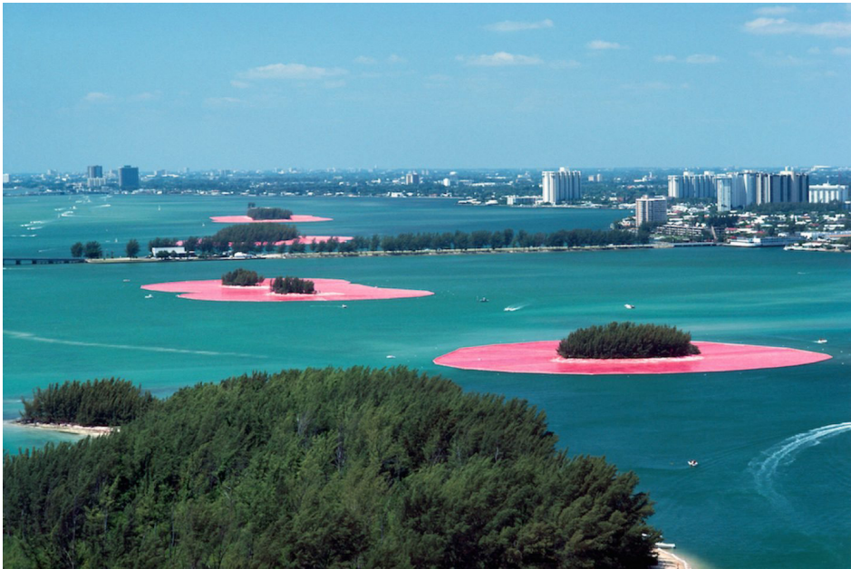
Görsel 7. Christo-Jeanne Clude, Çevreleyen Adalar , 1983, Florida.

Çevreci Sanat adı altında en önemli isimlerden Christo ve eşi Jeanne Claude 1960 lardan beri gerçekleştirdikleri dev eserler ile çevrelerini etkilemiş, insan algısını değiştirmiş dönüştürmüşlerdir. Dünyanın bir çok ülkesinde doğaya olan duyarlılıklarını insanlarla paylaşmak için eserler üretmişlerdir. Bunlardan bir tanesi de göl sularının çekilmesi ve su kirliliği üzerine dikkat çekmek amacı ile yaptıkları The Surrounded Islands çalışmasıdır.