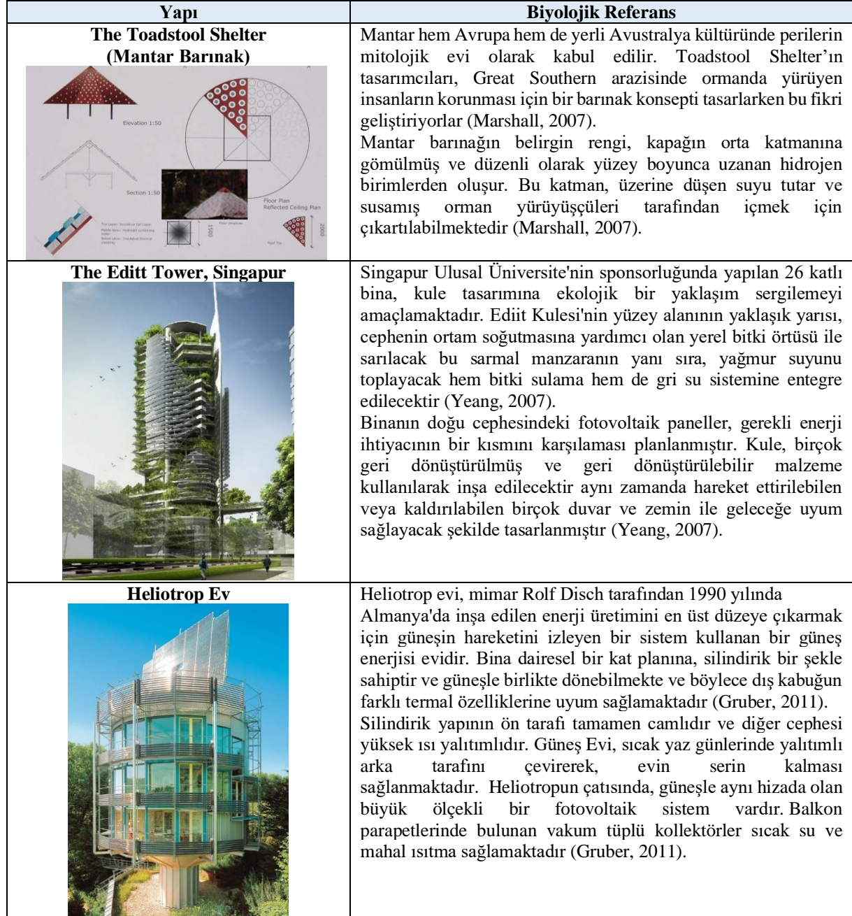
Tablo 2: Ekomimetik tasarım örnekleri

bir şehir hedeflenmiştir. Bu şehirde rüzgârdan enerji üretmek için rüzgâr türbinleri, güneş enerjisinden enerji üretmek amacıyla yapıların çatı ve cephelerinde fotovoltaik paneller tasarlanmıştır (Yazıcıoğlu, 2020). Ekosistem temelli birçok tasarım örneği mevcuttur bunlardan bazıları Tablo 2’ de verilmiştir.