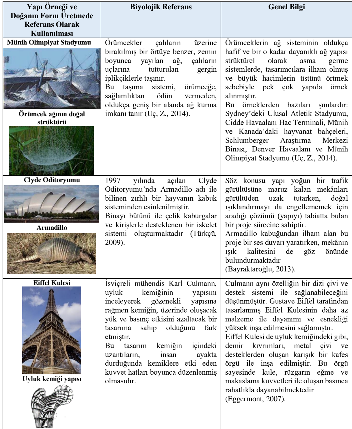
Tablo 1: Biyomimetik tasarım örnekleri