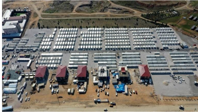
Şekil 5: Gaziantep İslâhiye Kalyon Konteyner Kent

Gaziantep’in İslâhiye ilçesinde Kalyon Holding ve AFAD iş birliği ile kurulan konteyner kent 52.000 m 2 alana toplam 3 bin kişilik 500 konteynerden oluşmaktadır. Her bir ünite 6 ila 8 kişili, soba ile ısıtılan tek odalı birimlerdir. Konteyner kent depremzedelerin ihtiyaçları için, eğitim birimleri, 450 m 2 çocuk oyun alanı, sosyal giyim market, sosyal gıda market, kuaför, berber, kütüphane, bilim ve teknoloji merkezi, çamaşırhane, yemekhane, mescit, idari ofisler ve fırın içermektedir. Ayrıca bir psikolojik destek ekibi bulunmaktadır. Konteyner kentin enerji ihtiyacını karşılamak adına güneş panelleri kurulmuştur, Şekil 5 (URL-2)