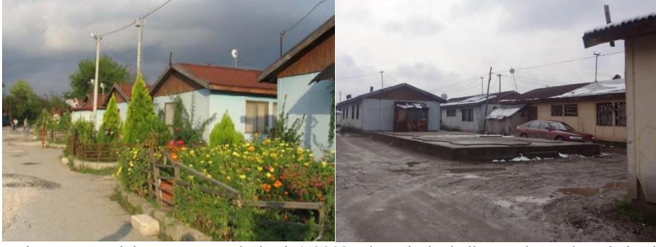
Şekil 2: Kiremit Ocağı Geçici Barınma Yerleşkesi a) 2008 yılı yerleşke halkının oluşturduğu bahçeler (Johnson, 2008) b) 2015 yılı deforme olmuş geçici konutlar (Ceylan,2015)

olan yerleşkede küçük bir market, kafeterya, nakış atölyesi ve oyun alanı gibi toplumsal ihtiyaçları karşılayacak birimler oluşturulmuştur, Şekil 2 (Johnson, 2007) Kaynak makalenin yayımlandığı 2007 yılında tüm üniteler hala mesken olarak kullanılmaktadır. Ünitelerin dışına sebze ve çiçek bahçeleri kurulmuş ve bazı ünitelerin. Ancak 2012 yılında belediye bölgedeki prefabrik konutların yıkılması kararı almıştır. Karar sonrası ünitelerde yaşayan halk karara karşı çıkmıştır. 2015 yılında Hande Ceylan tarafından yayınlanan tez çalışmasına göre bölgede hala yaşamını sürdüren aileler bulunmaktadır. Bölgedeki aileler özellikle kadınlar sosyal sağlıklarını korumada güçlük çekmektedir. (Ceylan,2015) Daha sonra belediye tarafından yıkım kararıyla bölge boşaltılmıştır. Günümüzde alanda bulunan konutlar kaldırılmış yerine başka bir yapı inşa edilmiş durumdadır.