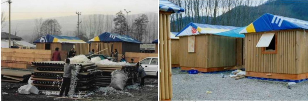
Şekil 3: Düzce Kaynaşlı Kağıt Tüp Geçici Konutlar (Özcan, Güler & Korkmaz, 2021)

üstüne sürülen vernikle ömrü uzatılabilir, Şekil 3 (Özcan, Güler & Korkmaz, 2021; Tütüncü & Ökten, 2021; İlhan, 2010)