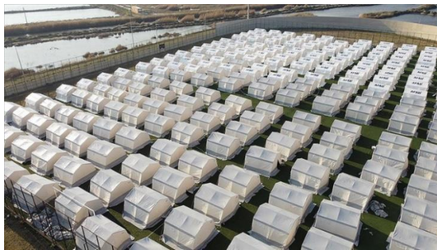
Şekil 4: Hatay'da Deprem Sonrası Kurulan Çadır Kent

6 Şubat 2023'te moment büyüklüğü ölçeğine göre 7,8 ve 7,5 büyüklüğündeki iki güçlü depremle başlayan son trajedi, 50.783 can kaybıyla sonuçlanmıştır. Bu depremler 11 ili ve toplam nüfusun %16,4'ünü temsil eden yaklaşık 14 milyon insanı etkilemiştir. (EM-DAT) Oldukça büyük hasarlar veren depremde can kaybının yanı sıra çok sayıda insan evsiz kalmıştır. Bazıları başka illere göç etmişlerdir, Şekil 4