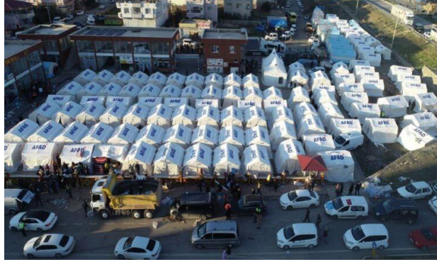
Şekil 6 : Gaziantep Islahiye Otobüs Terminali Çadır Kent

Çadırların düzensiz ve yakın mesafede kurulması yangın, salgın hastalık ve güvenlik sorunlarının yaşanabilme olasılığını arttırmaktadır. Ayrıca ortak yemekhane, sağlık ocağı, mobil tuvalet, banyo gibi donanımların eksikliği görülmektedir. Altyapıdaki eksiklikler halkın sağlığını önemli ölçüde etkilemektedir. Çadır kentler mahremiyet açısından da eksiklik yaratmaktadır. Uzun süre kullanım için uygun değildir, Şekil 6.