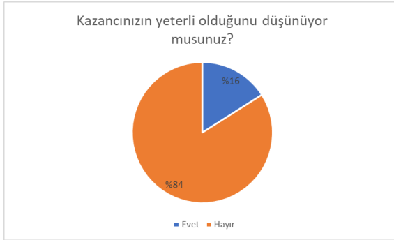
Şekil 4. Katılımcıların kazançlarının yeterli olup olmadığına ilişkin görüşleri.

Ekonomik durum ile ilişkili son soruda katılımcıların kazançlarını yeterli bulup bulmadığı sorulmuştur. Şekil 4'te görüleceği üzere çalışmaya katılan göçmenlerin büyük çoğunluğu (%84) kazançlarının yeterli olmadığını belirtmiştir.