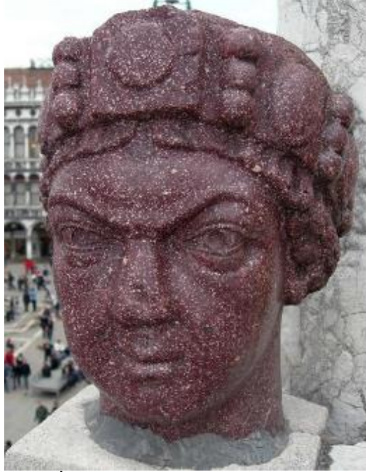
Şekil 30: İmparator Başı, Venedik, (URL 10)

kabartma (Eyice, 2004:197), (Şekil 31) ve taşa oyulmuş aslan başı (Nelson,2010:76-77), (Şekil 32) kabartması bunlara örnektir.