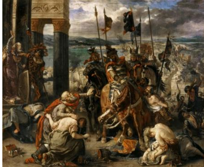
Şekil 1: E. Delacroix, Konstantinopolis'in Haçlılar tarafından Zaptı, Louvre Müzesi, Paris

IV. Haçlı seferi ile Galata kuşatılıp Haliç'e girildikten sonra 1203 yılında işgal edilen ve 1204 yılında ele geçirilen Konstantinopolis bu süreçte büyük hasara uğramıştır. 1204'te yağmacıların şehri üç gün boyunca talan etmesi ile çok sayıda kişi yaşamını yitirmiş, kalanların büyük bir kısmı ise Anadolu'ya kaçmıştır. Ele geçirilen ganimetler ve topraklar paylaşıldıktan sonra, Latin imparatoru Baudouin ve baronlar şehrin saraylarına yerleşmiş, kilise ve manastırlar Latin din adamlarının eline geçmiştir. Latin döneminde dini inanç farklılıklarından kaynaklanan bakımsızlık sebebiyle pek çok kilise ve manastır yıkılmış, imparatorların para sıkıntısı çekmesi nedeniyle kentin yağmalanmasına devam edilmiştir. Bronz heykeller eritilmiş, çeşitli heykeller ve kutsal rölikler kendi ülkelerindeki kiliselere gönderilmiştir. Kilise çatılarının kurşunları çıkartılmış, Manastırlarda ve saraylardaki ahşaplar ısınmak amacıyla yakılmıştır. Latin egemenliği altındaki şehir yarım yüzyılda zenginliklerini yitirmiştir. (Müller-Wiener, 2002:25-26)