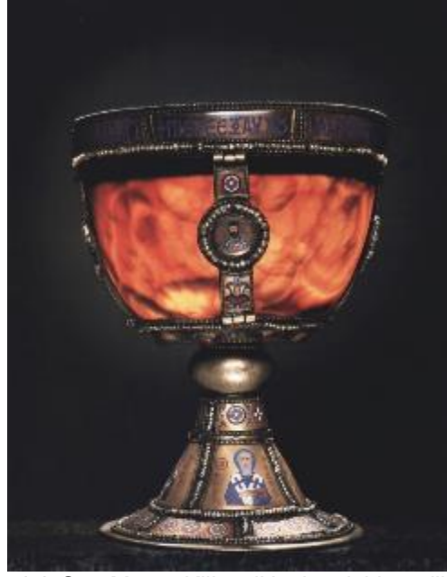
Şekil 11: (Solda) Aziz George'un kol kemiği, San Marco Kilisesi Hazinesi, Venedik Şekil 12: (Sağda) Bizans İmparatorluk Kadehi, San Marco Hazinesi, Venedik (Buckton & Prior (Ed.),1984)

Aya İoannes Prodromos Kilisesi'nden götürülen Aziz George'un kol kemiği (Riant, 1875:204) (Şekil12) günümüzde San Marco Hazinesinde bulunmaktadır. Kutsal emanetlerin yanı sıra San Marco Kilisesi Hazinesi'nde IV. Haçlı seferi ile götürüldüğü bilinen birçok kadeh (Şekil 13), aydınlatma elemanları ve pek çok değerli eşya (Şekil 14-15-16-17) yer almaktadır (Buckton, Pior,1984:159).