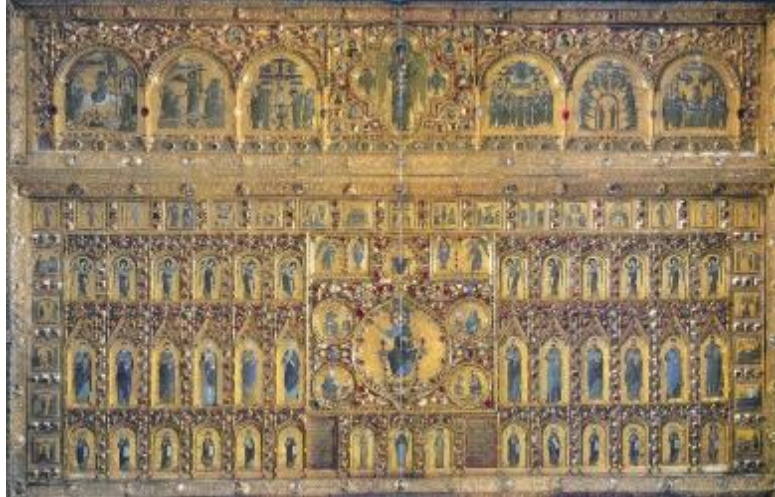
Şekil 22 :Pala d'Oro, San MarcoHazinesi, Venedik (Buckton&Prior (Ed.),1984)

Comte Riant'ın götürülen eserleri sıraladığı listesinde; Studiyos Manastırı kilisesinden ve diğer kiliselerden Vaftizci Yahya'ya ait kutsal kalıntıların götürüldüğünü belirtir. (Riant, 1875:200) Vaftizci Yahya'nın yüz kemikleri günümüzde Amiens Katedralinde bulunmaktadır (Şekil 23) Hz. Yahya'ya ait Kafatası kemiklerinin bir bölümü ve kol kemiği Topkapı Sarayı'nda Mukaddes Emanetler bölümünde sergilenmektedir. (Şekil 24) Altın bir plakanın üzerine yapıştırılan ve üzerinde değerli taşlarla süslü atın bantlar bulunan kafatası kemikleri Fatih Sultan Mehmed döneminde (1451-1481) saraya getirilmiş, ardından Cem Sultan'ı ellerinde tutmaları için Rodos şövalyelerine gönderilmiştir. 1585'te Lefkoşa Kalesi'nde tekrar ele geçirilip İstanbul'a getirilmiştir. (Bozkurt, 2006:110) Bu durum Konstantinopolis'te bulunan kutsal emanetlerin nasıl parça parça götürülerek pek çok coğrafyaya yayıldığını göstermektedir.