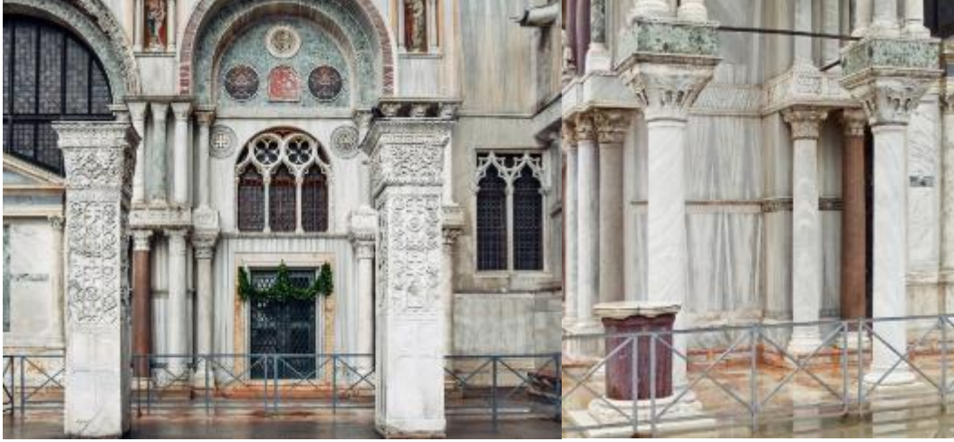
Şekil 18: (Solda) Aziz Polyektos Kilisesi'ne ait sütunlar, San Marco Kilisesi Güney Cephesi, Venedik Şekil 19: (Sağda) Aziz Polyektos Kilisesi'ne ait sütun Başlıkları, San Marco Kilisesi Güneybatı Cephesi, Venedik (Maquire & Nelson (Ed), 2010)