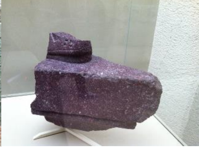
Şekil 27: (Solda) Tetrark Heykeli, San Marco Kilisesi, Venedik (Eyice, 2004) Şekil 28: (Sağda) Tetrark Heykelinin Ayak Parçası, İstanbul Arkeoloji Müzesi (2018)