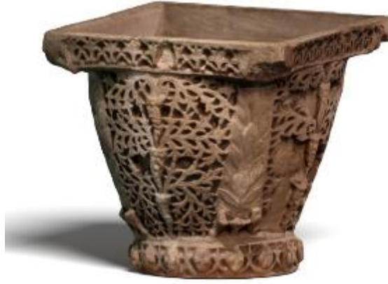
Şekil 20: Aziz Polyektos Kilisesi'ne Ait Sütun Başlığı, Katalan Arkeoloji Müzesi, Barselona