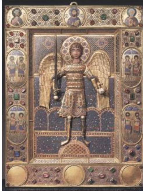
Şekil 14: Melek Mikail Figürlü İkon, San Marco Hazinesi, Venedik (Buckton & Prior (Ed.),1984)

Aya İoannes Prodromos Kilisesi'nden götürülen Aziz George'un kol kemiği (Riant, 1875:204) (Şekil12) günümüzde San Marco Hazinesinde bulunmaktadır. Kutsal emanetlerin yanı sıra San Marco Kilisesi Hazinesi'nde IV. Haçlı seferi ile götürüldüğü bilinen birçok kadeh (Şekil 13), aydınlatma elemanları ve pek çok değerli eşya (Şekil 14-15-16-17) yer almaktadır (Buckton, Pior,1984:159).