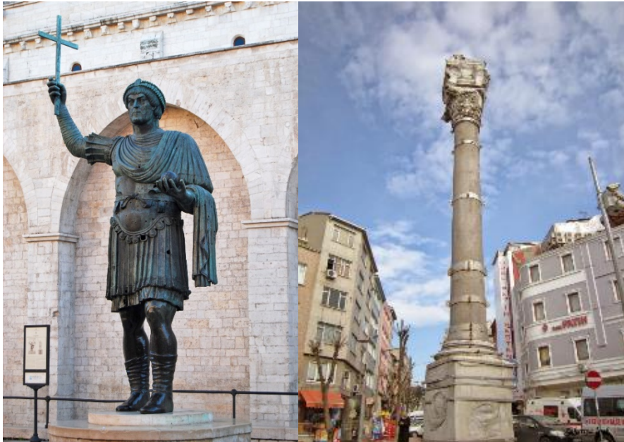
Şekil 7: (Solda) Barletta Heykeli, S. Sepolcro Kilisesi, Barletta(URL1) Şekil 8: (Sağda) Marcianus Sütunu (Kız Taşı), Fatih, İstanbul (2015)

İtalya'nın güney bölgesinde Haçlıların İstanbul yağmasından elde edilen bronzdan bir Roma imparatoru heykeli bulunmuştur. (Şekil 7) Heykelin V. yy'da imparatorluk makamına yükselen Marcianus olduğu ve heykelin İstanbul'da Fatih'te Kıztaşı da denilen Marcianus Sütunu'nun (Şekil8) üstünde bulunduğu ve yağmada buradan indirilerek götürüldüğü kaynaklarda geçmektedir. Ancak heykelin ölçüleri Kız taşı anıtının mermer sütunun gövdesine nazaran çok büyük olduğundan buradan gelmesi olası görünmemektedir. (Eyice, 2004:197-198) Bu eser günümüzde Barletta kasabasında S. Sepolcro Kilisesi'nin önünde bulunmaktadır.