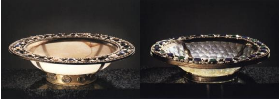
Şekil 15: Bizans Kâseleri, San Marco Hazinesi, Venedik (Buckton&Prior (Ed.),1984)