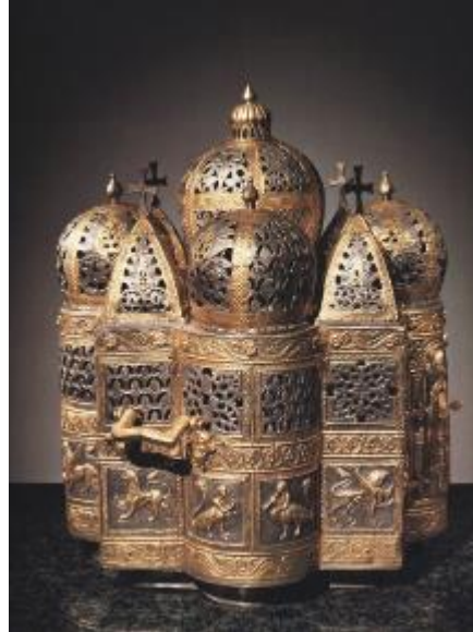
Şekil 17: Havayyun Kilisesi Şeklindeki Tütsülük, San Marco Hazinesi, Venedik (Buckton & Prior (Ed.),1984)

Aziz Polyeuktos Kilisesi de bu süreçte tam anlamıyla talan edilmiştir. Sütunlarının ve sütun başlıklarının pek çoğu Venedik'e, birkaç tanesi ise Barselona'ya götürülmüştür. (Müller-Wiener, 2002:191) Venedik'e götürülen sütun ve sütun başlıkları (Şekil18-19) San Marco Kilisesi'nin güneybatı cephesine yerleştirilmiştir. Barselona'daki sütun başlığı ise Katalan Arkeoloji Müzesinde bulunmaktadır (Şekil 20).