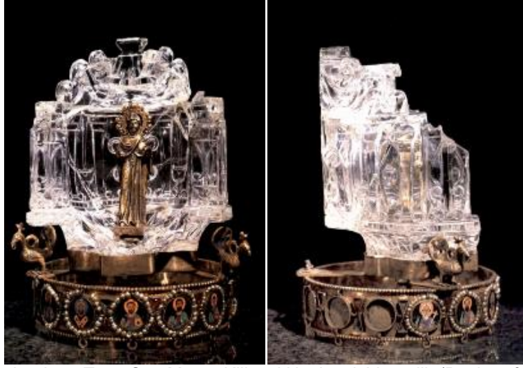
Şekil 9: İmparator Leo'nun Tacı, San Marco Kilisesi Hazinesi, Venedik (Buckton&Prior (Ed.),1984)

kaplamalar, benzer değerli madenler kiliseden katırlar ile taşınarak götürülmüş, (Khoniates, 2013:148) kilisenin sunağının üzerinde ve arkasında bulunan “ciborium” olarak adlandırılan, binlerce parlak gümüş parçalarından yapılmış üzeri kalın bir altın tabaka ile kaplı parçalar da sökülüştür. (Khoniates, 2013:238)