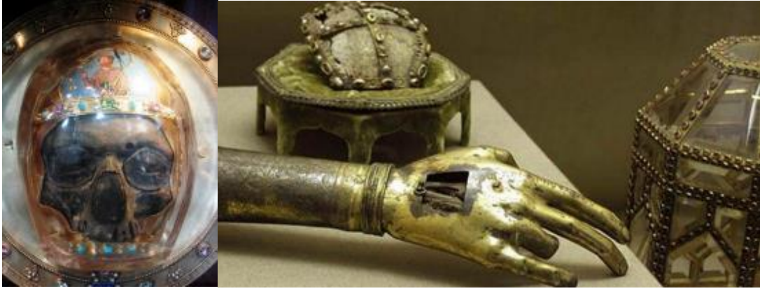
Şekil 23: (Solda) Vaftizci Yahya'nın Yüz Kemikleri, Amiens Katedrali, Fransa (URL6) Şekil 24: (Sağda) Yahya Peygamberin Kol ve Kafatası Kemiği, Topkapı Sarayı Mukaddes Emanetler Bölümü, İstanbul (URL 7)

Bu süreçte Bukoleon Sarayı Latin imparatorunun konutu olmuştur. Clari Bukoleon Sarayı'nda bulunan bir kiliseden yapılan yağma ile kutsal emanetlerin Fransızlar tarafından alınıp götürüldüğünü anlatmıştır. (Clari,1994:46) Comte Riant buradan götürülenleri şu şekilde listelemiştir; Kundak Giysisi Parçası, Kutsal diken, Aziz Philippe'in dişi, kafatası kemikleri, Gerçek Haç rölikleri, (Şekil 25-26) değerli mücevherler, İmparatorluk giysileri, Kutsal tacın dikenleri, Musa'nın asası, Aziz Simon'un kafatası, Hz. Meryem'in örtüsü, Aziz Etienne'nin emanetleri, Konstantin'in kalıntıları, altın haç, Vaftizci John'un kaşığı, meleklerin bulunduğu tablo, kutsal gözyaşı, kutsal kan, Aziz James'in kolu, Hz. Meyem'in sütü, Aziz Elizabeth'in kalıntıları, Bizans imparatorluk tacı..(Riant,1875:180-184).