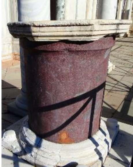
Şekil 29: Tetrark Sütunu, San Marco Kilisesi, Venedik (URL9)

Ayrıca San Marco Bazilikası'nın balkonunun güneybatı köşesinde Venedikliler tarafından Konstantinopolis'ten yağmalanarak getirilen bir imparator başı da bulunmaktadır. Kaynaklarda bu heykelin II. Justianus'a ait olabileceği belirtilmektedir. (Breckenridge, 1981:1) (Şekil 30) Konstantinopolis'in yağmasından Haçlılar tarafından savaş ganimeti olarak birçok taş kabartma Venedik'e getirilmiş ve şehirdeki binalarda kullanılmıştır. Bizans imparatorunu tasvir eden bir yuvarlak taş