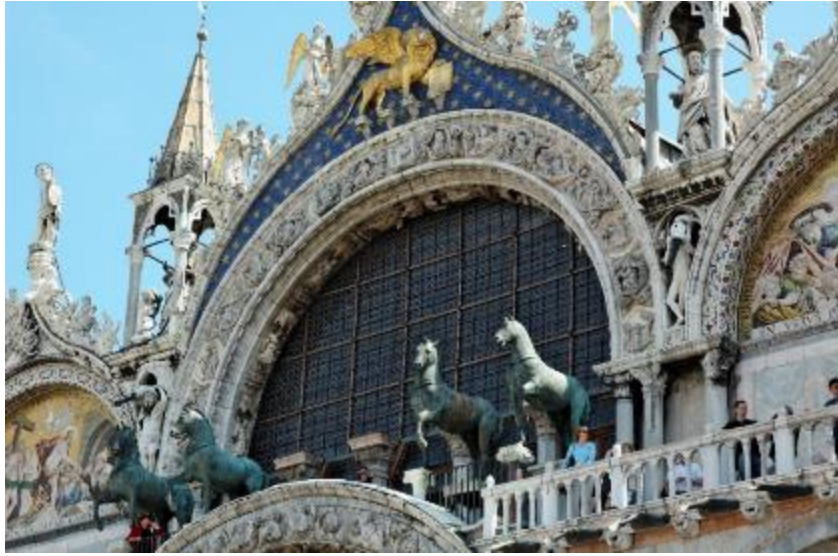
Şekil 5:Quadriga Heykeli'nin Replikaları, San Marco Kilisesi Cephesi, Venedik(2013)

Hipodromda yer alan ve Haçlılar tarafından yok edilen bir başka önemli eser de tunçtan yapılmış bir kartal heykelidir. Bu heykeli Tyna'lı Apollonios'un sihirli sanatının parlak bir eseri olarak niteleyen Niketas, heykeli şöyle anlatmıştır; “bir sütunun üzerine yerleştirilmiş olan kartalın estetiği ile görenleri kendisine hayran bırakmaktadır. Kartalın kanatları sanki her an uçacakmış gibi açıktır. Uçmasını engelleyen şey ise pençelerine dolanmış bir yılanıdır. Kartal ve yılanın bu mücadelesinde yılan kartalın keskin pençeleri altında kaybetmiş bir vaziyettedir. Kartal bu zaferi karşısında zafer şarkısı çiyaklıyor gibi durmaktadır. Kartalın kanatları 12 parçadan oluşmakta ve güneşin ışınları çarptığı zaman, günün saatlerini göstermektedir.” (Khoniates, 2013:244) Bizans sanatında Kartal ve yılan mücadelesi başka eserlerde de işlenmiştir. Günümüzde Büyük Saray Mozaikleri müzesinde koruma altında olan temsil bu kompozisyonu anımsatmaktadır (Şekil 6).