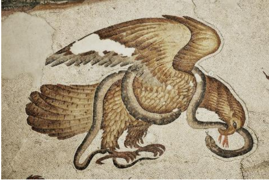
Şekil 6:Kartal ve Yılan Mozaiği, Büyük Saray Mozaikleri Müzesi, İstanbul (2017)

İtalya'nın güney bölgesinde Haçlıların İstanbul yağmasından elde edilen bronzdan bir Roma imparatoru heykeli bulunmuştur. (Şekil 7) Heykelin V. yy'da imparatorluk makamına yükselen Marcianus olduğu ve heykelin İstanbul'da Fatih'te Kıztaşı da denilen Marcianus Sütunu'nun (Şekil8) üstünde bulunduğu ve yağmada buradan indirilerek götürüldüğü kaynaklarda geçmektedir. Ancak heykelin ölçüleri Kız taşı anıtının mermer sütunun gövdesine nazaran çok büyük olduğundan buradan gelmesi olası görünmemektedir. (Eyice, 2004:197-198) Bu eser günümüzde Barletta kasabasında S. Sepolcro Kilisesi'nin önünde bulunmaktadır.