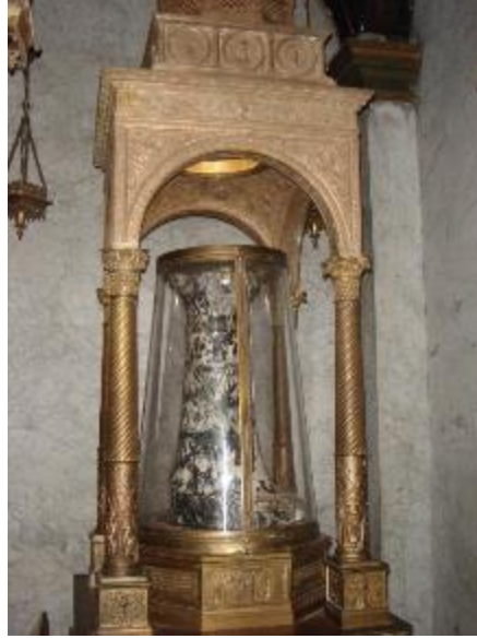
Şekil 21: Kırbaçlama Sütunu, SantaPraxede Kilisesi, Roma (URL 5)