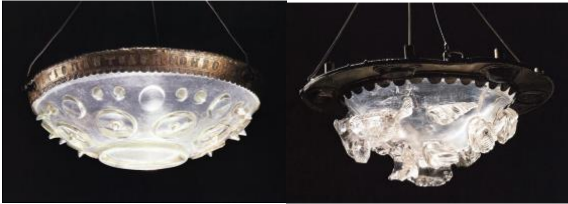
Şekil 16: Askılı Cam Avizeler, San Marco Hazinesi, Venedik(Buckton&Prior (Ed.),1984)