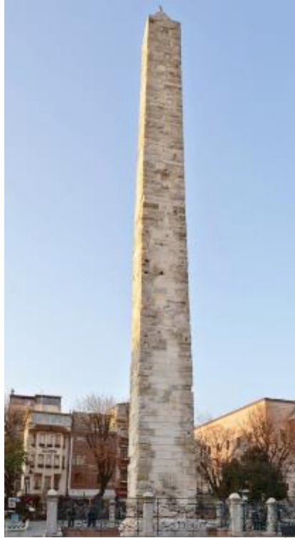
Şekil 3:Örne Dikilitaş, Sultanahmet Meydanı, İstanbul (2018)