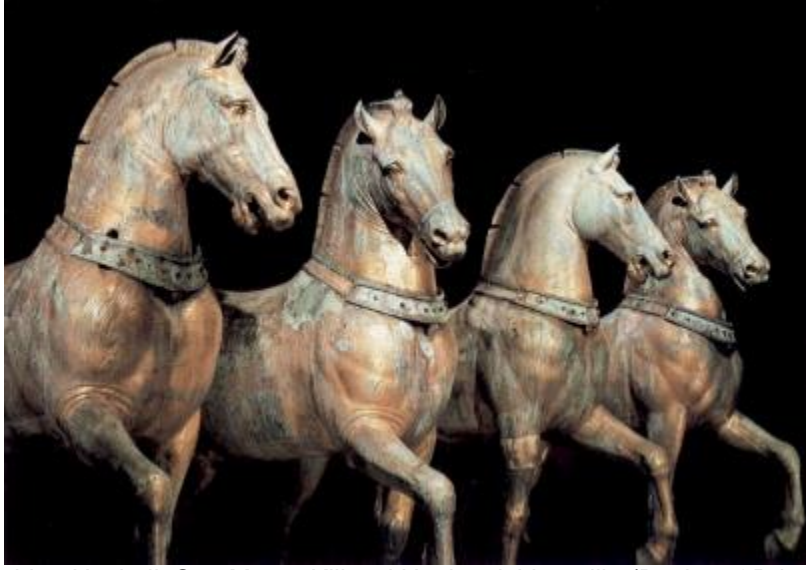
Şekil 4:Quadriga Heykeli, San Marco Kilisesi Hazinesi, Venedik, (Buckton&Prior (Ed.),1984)