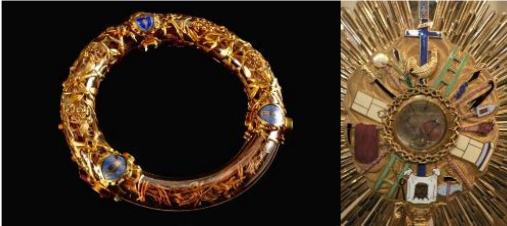
Şekil 10: (Solda) Hz. İsa'nın Tacı, Notre Dame Kilisesi, Paris (URL 2) Şekil 11: (Sağda) Kutsal Dikenler, Aziz Matthew kilisesi, Perpignan (URL 3)