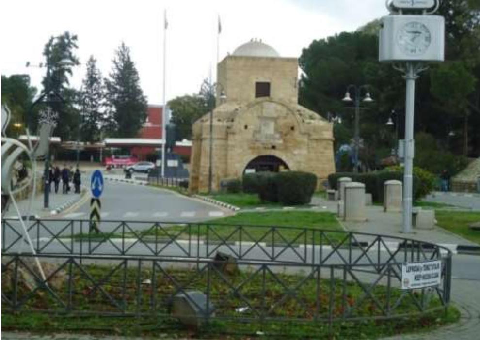
Şekil 6- Girne Kapısı Kuzeyde Atatürk Heykeli, Güneyde Saat (Z. Turkan – 2020)

Türkiye İş Bankası K.K.T.C. Müdürlüğü'nden edindiğimiz bilgilere göre; 1963 yılında, Girne Kapısı'nın kuzey ve güney cephelerindeki suricine giriş-çıkış yollarının arasında yer alan refüjlerde düzenleme yapılmış ve 29 Ekim 1963 tarihinde, kuzey yöne Atatürk'ün büyük bir heykeli, güney yöne de metal ayak üzerine monte edilmiş Türkiye İş Bankası'nın nostaljik metal kumbarası biçiminde saat yerleştirilmiştir (Şekil 6).