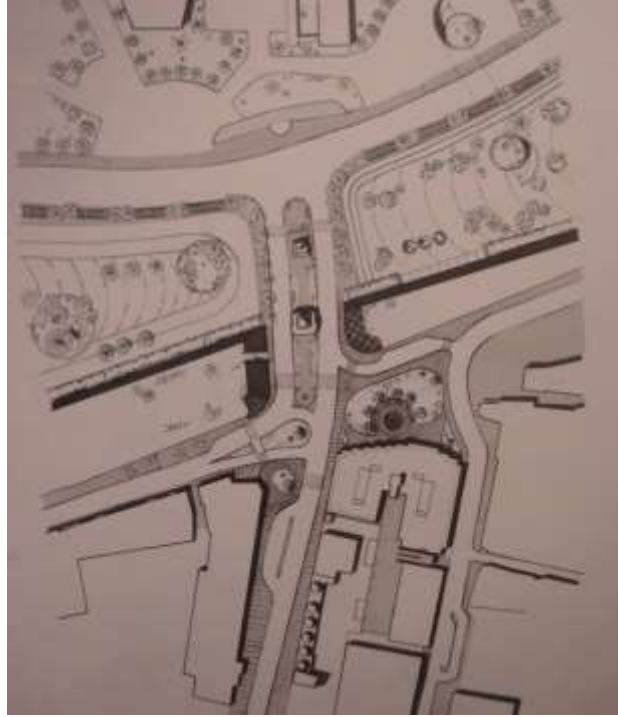
Şekil 1- Girne Kapısı ve Çevresi Tarihi Dokusu Planı (The Central Area of Nicosia, Nicosia Master Plan – 1985)

Girne Kapısı günümüzde, çevresindeki tarihi doku oluşumları ve güneyindeki İnönü Meydanı ile kentin sosyal ve siyasi yaşamına damgasını vuran önemli bir tarihi doku parçasını teşkil etmektedir. Girne Kapısı ve çevresi tarihi dokusunun oluşum ve gelişimini, kronolojik sırayla şöyle izlemekteyiz (Şekil 1):