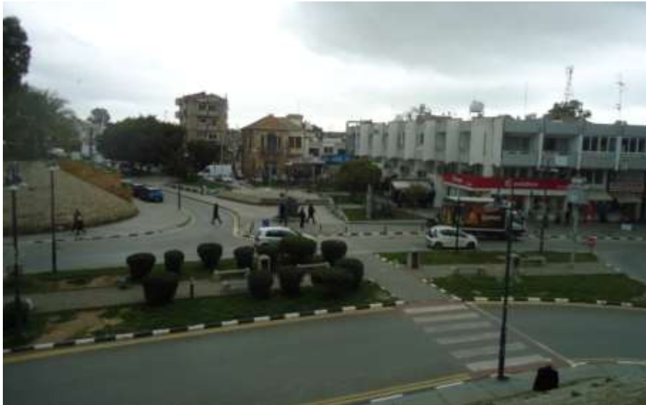
Şekil 9- Günümüzde İnönü Meydanı (Z. Turkan – 2020)

Meydanda 1989 yılında, Lefkoşa Türk Belediyesi tarafından yapılan düzenleme çalışmaları ile bu alandaki motorlu araç trafiğinin akışı da yeniden planlanmış ve meydana, Kıbrıs Türk toplumunun ilk lideri Dr. Fazıl Küçük'ün heykeli yerleştirilmiştir. Meydan, 1990'lı yıllardan itibaren gerek siyasi partilerin toplantıları, gerekse sosyal eğlence amaçlı toplantılar için kullanılmakta ve Lefkoşalılara olduğu kadar, bazen de Kuzey Kıbrıs genelinden gelenlere ev sahipliği yapmaktadır. Tarihi Girne Kapısı yapısı, yakın geçmişte restore edilmiş ve K.K.T.C. Turizm Bakanlığı tarafından, turizm danışma ofisi olarak işlevlendirilmiştir. Günümüzde, meydanın batısındaki iki katlı taş konut binası, KKTC Yüksek Yönetim Denetçisi Ombudsman ofisi, Ziraat Bankası binası ise KKTC Gençlik Dairesi Lefkoşa Gençlik Merkezi olarak kullanılmaktadır. Girne Kapısı ve çevresi tarihi dokusu halen, bünyesindeki İnönü Meydanı ile kuzey Lefkoşa'nın önemli bir ticari ve sosyal alanı olarak kent halkının yaşamında yer almakta ve işlevlerini sürdürmektedir. Meydan, çeşitli sosyal ve siyasi toplantılar için yaptığı ev sahipliği ile de Kuzey Kıbrıs'ın yakın tarihine damgasını vurmaktadır (Şekil 9).