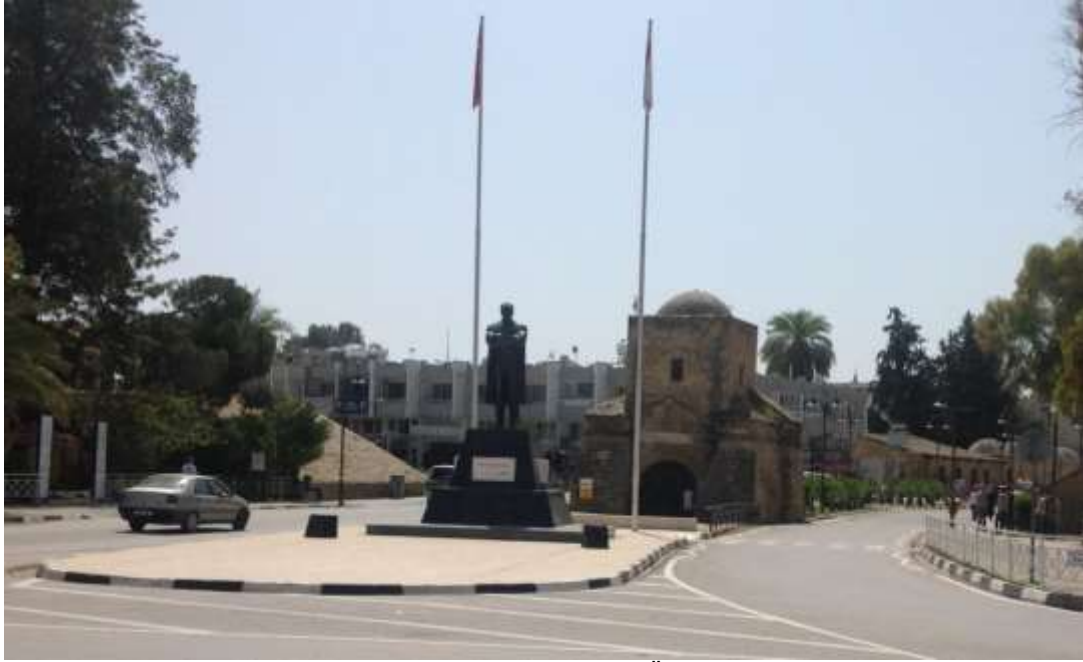
Şekil 4- Günümüzde Girne Kapısı (Ö. Tuğun – 2020)