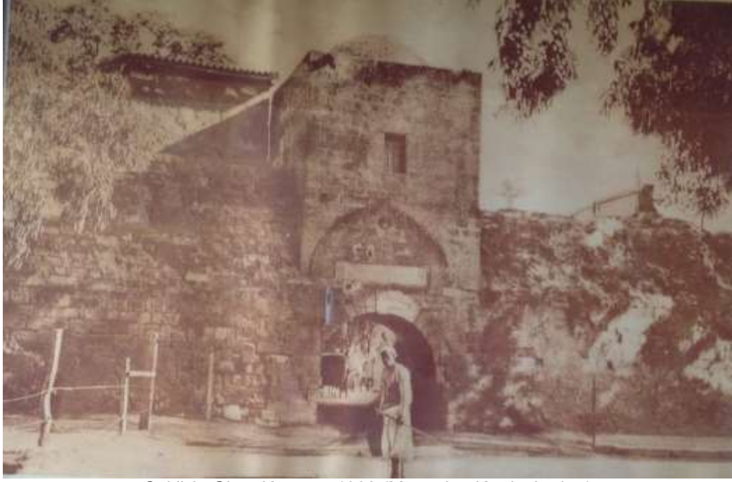
Şekil 3- Girne Kapısı – 1930