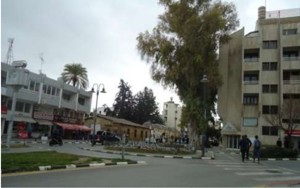
Şekil 8- Solda Vakıflar Çarşısı ve Mevlevi Tekkesi, Sağda Ziraat Bankası Binası

Girne Kapısı'nın güneybatısındaki köşe parselde yer alan ve geçmişten bu yana, kahvehane, lokanta, pastahane olarak kullanılan tek katlı bina, 1980 yılında yıkılarak yerine betonarme, dört katlı banka binası (Ziraat Bankası) inşa edilmiştir (Şekil 8). Yine bu dönemde, banka binasının güney yönündeki bitişik nizamdaki parsellerde, Mevlevi Tekkesi'nin batı karşısında, iki katlı yığma taş binaların yerine çok katlı betonarme binalar inşa edilmiştir.