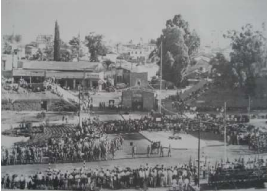
Sekil 7- Girne Kapısı Tarihi Dokusunda Tören – 1965 (A. Sayıl'dan)

Kıbrıs Cumhuriyeti sonrası, adada oluşan yeni idari statü ile kısıtlı yaşam koşulları ve olanaksızlıklar, Lefkoşa Türk toplumunun sosyal ihtiyaçları doğrultusunda çözümleri gündeme getirmiştir. Buna bağlı olarak da Lefkoşa'da sosyal buluşma ve eğlence için Girne Kapısı'nın kuzey yönündeki sur hendeğinin doğu yanında Mücahitler Parkı, batı yanında ise Kuşulu Park isimli alanlar düzenlenmiştir. Bu iki park, gerek çocuklar, gerekse yetişkinler için eğlence aktiviteleri ile kentin ve dokunun çok yoğun kullanılan alanları olmuştur. Bu dönemde, Girne Kapısı'nın kuzey yönündeki sur hendeği ile eski Osmanlı Mezarlığı'nın bulunduğu alan arasındaki doğu-batı doğrultulu Cemal Gürsel Caddesi, kapının kuzey tarafındaki Atatürk heykelinin de burada yer alması sebebiyle milli günler için Lefkoşa'nın tören alanı olmuştur. Bu amaçla da caddenin kuzeyine, Atatürk Heykeli'nin karşısına, tören izleme için kademeli platform yapılmıştır (Şekil 7).