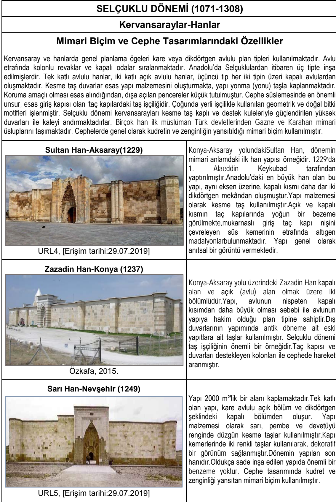
Tablo 1. Selçuklu dönemi konaklama yapıları