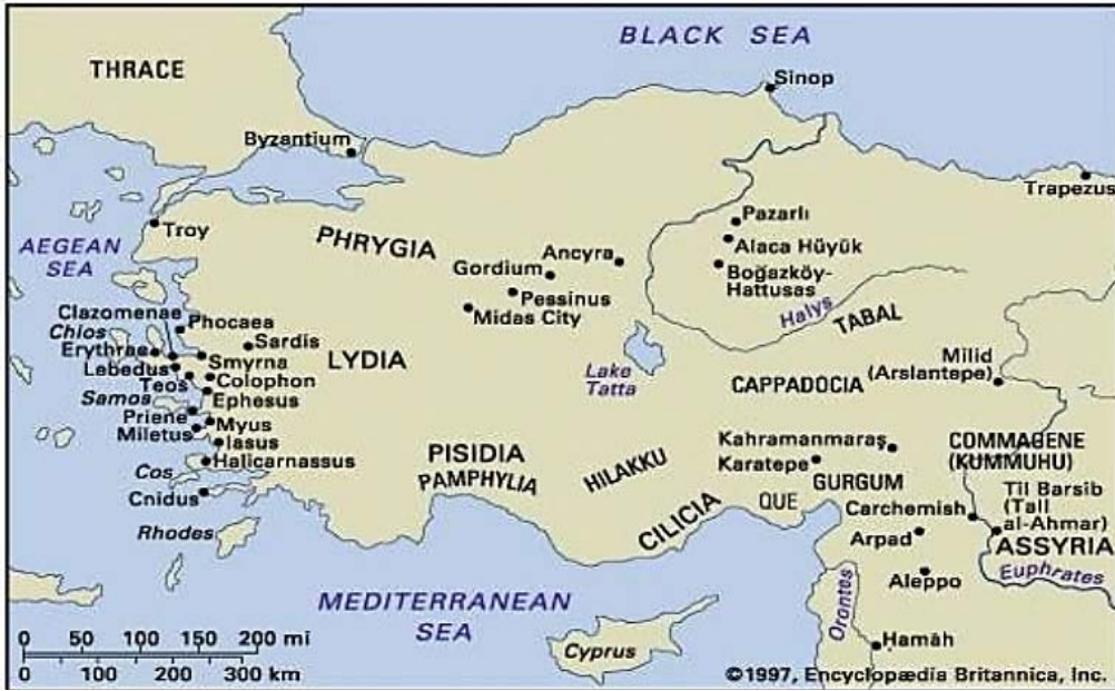
Şekil 2. Anadolu uygarlıklarının dağılımı (URL2)

Anadolu, Doğu (Asya) ile Batı (Avrupa)'yı birbirine bağlayan büyük göç yollarının ve medeniyetlerin geliştiği bir coğrafi alanıdır. Tarih öncesi uygarlıklardan günümüze kadar gelen kültürün oluşmasını sağlayan toplumların Anadolu'daki yerleşim alanları Şekil 1'de görülmektedir. Antik çağ toplumları yerleşik düzende kentler oluşturmuşlar, yerleşimleri birbirine bağlayan kara, deniz, nehir yollarından oluşan bir yol sistemi ve ağı kurmuşlardır. Bu yolların amacı ticaret ve askeri ağırlıklı olup daha düzenli, tekerlekli araçların geçmesine olanak sağlayacak şekilde yapılmışlardır. Aynı zamanda hayvan ve insanların kullandığı patika yolların izlerini gösteren kalıntılara rastlanmaktadır. Günümüzde bu ağı belirleyen kalıntılar üzerinde çalışılmaktadır. "Bunlar arasında Hitit-Asur ticaret kolonilerinin yollarını, Pers Kral Yolu'nu, Roma Dönemi Roma Askeri Yolu'nu ve bunun devamı mahiyetindeki, daha sonra İpek Yolu olarak bilinen Bizans'ın askeri ve ticaret yolu ile mil taşlarını kaydetmek mümkündür (Yavuz, 1997:3; Keçiş, 2013:850)."özetlemesini, (Demirci, 2014:101) yapmaktadır.