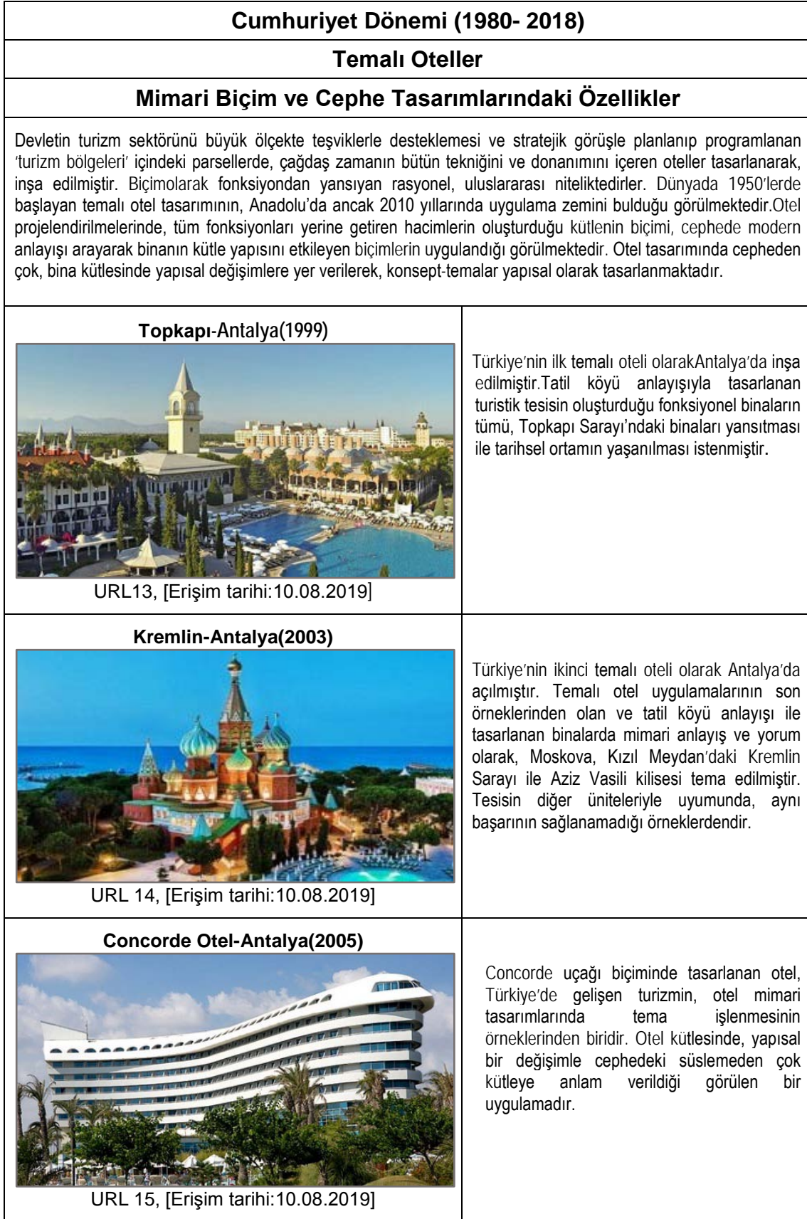
Tablo 5. Cumhuriyet dönemi (1980-2018) konaklama yapıları