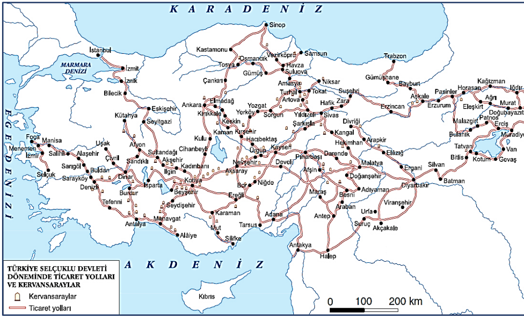
Şekil 3. Anadolu Selçuklu Devleti başlıca ticaret yolları ve kervansaraylar (URL3)

(Akdağ, 1979:35). “En mühim olanlarını gösterdiğimiz bu yollarda kalabalık kervan kabileleri aralıksız ticari eşya taşımakta olduklarından, soygunculuğa karşı güveni ve yolcuların geceleri konaklayacağı yerlerdeki istirahatlerini sağlamak bir meslek haline gelmişti. Bunun üzerine menzil olmaya elverişli yerlerde hanlar inşası usulü ortaya çıktı. Harabeleri bugün de gördüğümüz ve içlerinden bazıları birer mimari örneği olarak hala ayakta duran Selçuklu Kervansarayları o hayatın hatırasıdır.” bilgisini vermektedir. Aynı eserde bu çapta büyük binaların maliyetinin çok olduğundan dolayı Selçuklu sultanları, vezirler, emirler ve başka zenginler tarafından kendilerine gelir kaynağı sağlamak için yapıldıkları belgelenmektedir.Şekil 3'te, Selçuklu devletinin başlıca ticaret yolları ve bu yollar üzerindeki kervansaraylar görülmektedir.