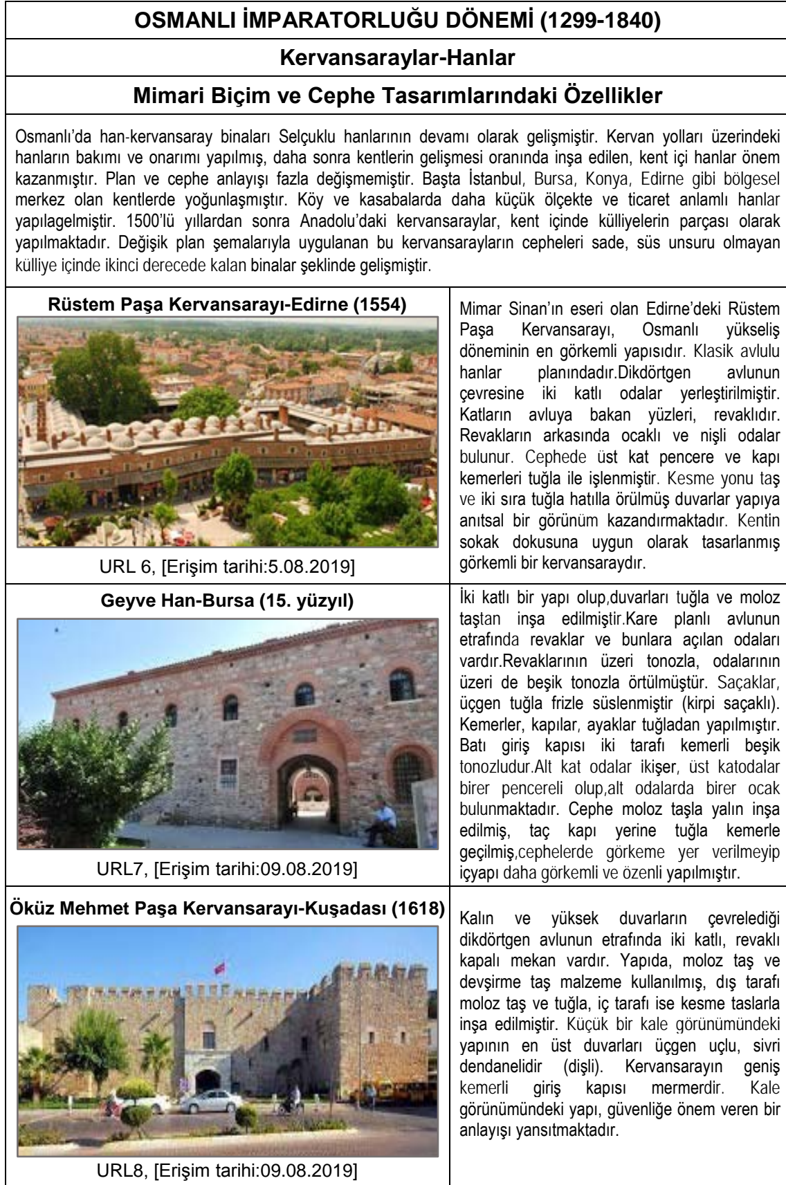
Tablo 2. Osmanlı dönemi (1299-1840) konaklama yapıları