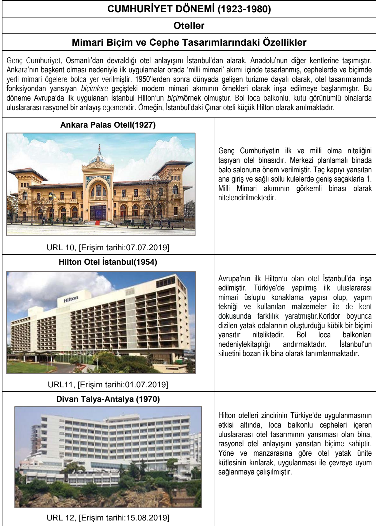
Tablo 4. Cumhuriyet dönemi (1923-1980) konaklama yapıları