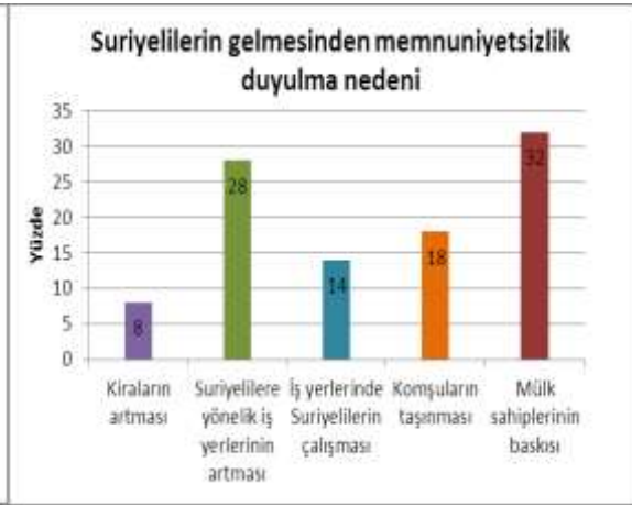
Şekil 3. Suriyelilerin gelmesinden memnuniyetsizlik duyulma nedeni