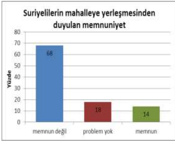
Şekil 2. Suriyelilerin mahalleye yerleşmesinden duyulan memnuniyet