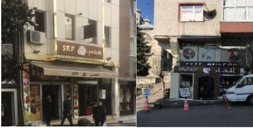
Şekil 6. Suriyeliler tarafından açılan işyerleri örnekleri

Suriyeliler öncelikli olarak, tekstil, inşaat, imalat, geri dönüşüm (kağıt toplama), berberlik gibi sektörlerde çalışmaktadırlar. Ekonomik açıdan gücü olan, girişimci Suriyeliler ise, küçük işletmeler açarak, çoğunlukla yine Suriyeli çalıştırarak ve çoğunlukla da Suriyelilere hizmet vermektedirler.