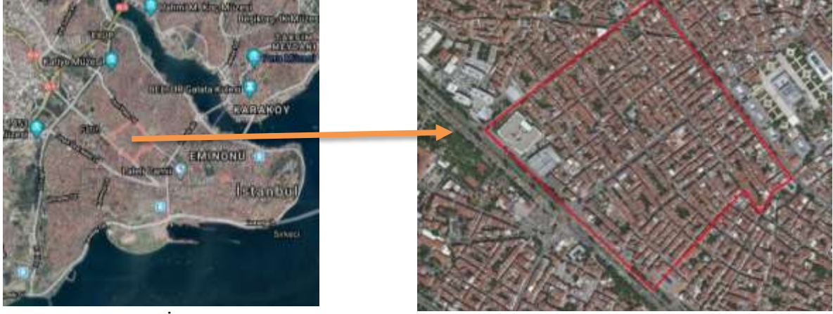
Şekil 1. Fatih İlçesi Akşemsettin Mahallesi konumu (Url 7, 2019 üzerinden üretilmiştir)

Çalışma alanı olarak Türkiye’de kayıtlı Suriyelilerin istatistik verilerine göre en yoğun yaşadığı 2. ilçe olan Fatih İlçesi’nin 57 mahallesinden biri olan Akşemsettin Mahallesi seçilmiştir (Şekil 1). Akşemsettin Mahallesi’nin seçilme nedeni, Fatih İlçesi’nin en kalabalık mahallesi olmasıdır. 2019 TÜİK verilerine göre 443.090 nüfuslu Fatih İlçesi’nde Akşemsettin Mahallesi nüfusu 28.234 olmuştur (Url 6, 2019).