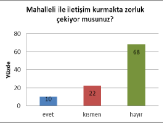
Şekil 6. Mahalleli ile iletişim kurmakta zorluk çekme oranı