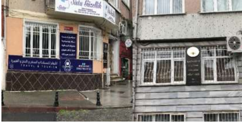
Şekil 5. Suriyeliler tarafından açılan işyerleri örnekleri