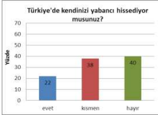
Şekil 5. Suriyelileri kendilerini Türkiye’de yabancı hissetme oranı