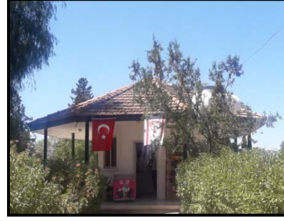
Şekil 6: Yiğitler Burcu Parkı büfe

Parkta çocuk oyun elemanları yer aldığı dört farklı bölüm yer almaktadır. Kaydıraklar ve salıncaklardan oluşan oyun alanlarında zemin kaplaması bulunmamakta, oyun elemanları, çocuklar için risk teşkil eden mevcut toprak zemin üzerinde konumlanmaktadır. Oyun elemanlarının, günümüzde bakımsız ve oldukça yıpranmış olmaları, parkın gerekli bakımdan yoksun olduğunu göstermektedir (Şekil 7).