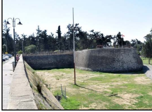
Şekil 3: Yiğitler Burcu Parkı genel görünüm (Kıbrıs Otel - 2020)

Parka, yeni düzenleme ile Lefkoşa Türk Belediyesi tarafından; büfe, çocuk oyun ekipmanları, banklar, bitkisel ögeler ve çöp kovası, aydınlatma elemanı gibi donatı elemanları sağlanmıştır (Şekil 4).