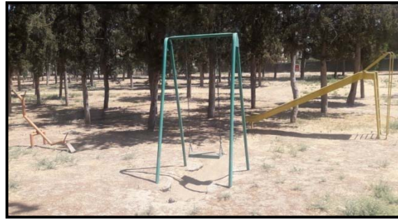
c) Çocuk oyun ekipmanları