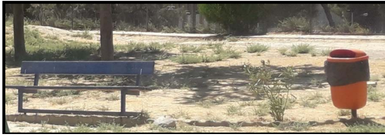
b) Bank ve çöp kovası