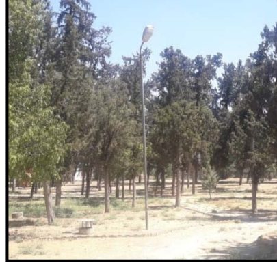
a) Aydınlatma elemanları