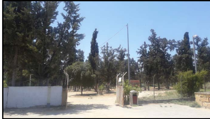
Şekil 4: Yiğitler Burcu Parkı genel görünüm (Yazar - 2020)

Parka, yeni düzenleme ile Lefkoşa Türk Belediyesi tarafından; büfe, çocuk oyun ekipmanları, banklar, bitkisel ögeler ve çöp kovası, aydınlatma elemanı gibi donatı elemanları sağlanmıştır (Şekil 4).