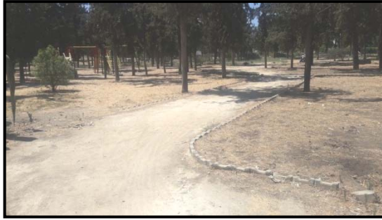
a) Toprak döşeme

Yiğitler Burcu Parkı'nın dolaşım alanları, işleve özel bir malzeme ile kaplanmamış, sıkıştırılmış toprak olarak bırakılmıştır. Parkta bulunan iki adet tuvalet, temiz kullanılmamak ve yetersiz bakım nedenleri ile kullanımları iptal edilmiştir (Şekil 9).