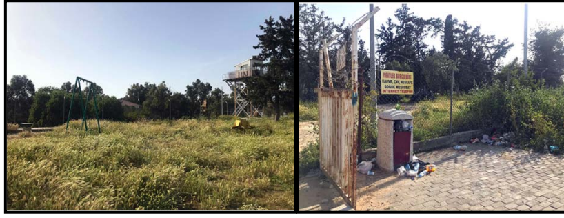
a) Otlar ile kaplı oyun alanları