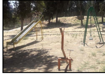
b) Çocuk oyun ekipmanları