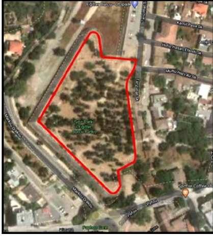
Şekil 2: Yiğitler Burcu Parkı uydu görüntüsü