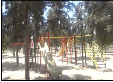
a) Çocuk oyun ekipmanları

Parkta çocuk oyun elemanları yer aldığı dört farklı bölüm yer almaktadır. Kaydıraklar ve salıncaklardan oluşan oyun alanlarında zemin kaplaması bulunmamakta, oyun elemanları, çocuklar için risk teşkil eden mevcut toprak zemin üzerinde konumlanmaktadır. Oyun elemanlarının, günümüzde bakımsız ve oldukça yıpranmış olmaları, parkın gerekli bakımdan yoksun olduğunu göstermektedir (Şekil 7).