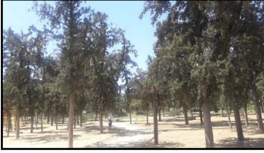
Şekil 5: Yiğitler Burcu Parkı bitkisel öğeler (Yazar - 2020)