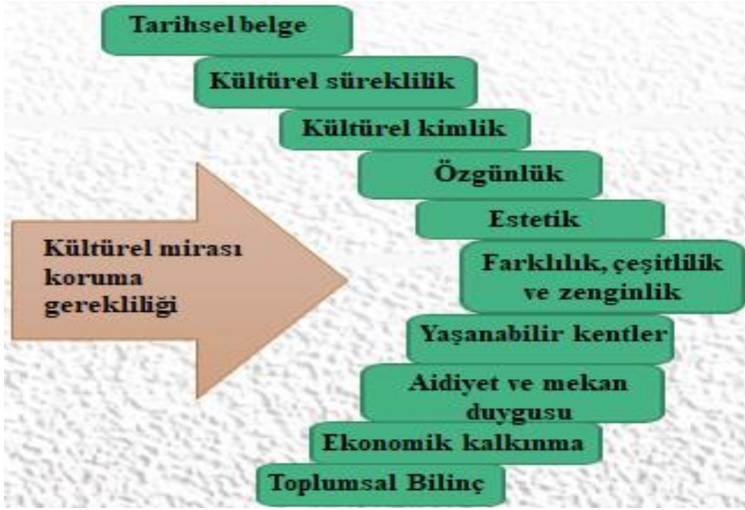
Şekil 1. Kültürel Mirasın Korunması Gerekliliği

Koruma, geleneksel bilginin veya dokunun sürdürülebilirliği için gereklidir. Amaca odaklı kentsel koruma, tarihi ve kültürü ile barışık bir toplum bilinci oluşturma ve değerli olanı korumaya yönelmekte, bu sebeple geçmişle bağ kurma ihtiyacını sürdürmektedir (Tekeli, 2009). Diğer yandan, insanoğlunun geçmişi ve şimdiki zamanı, kültürel dokuları ve birbirleri ile etkileşimi kentsel bir dinamizm üretir. Bu dinamizmin hızındaki artış kültürel sürekliliğin sağlanmasını güçleştirerek mirasın şimdiye kadar olduğundan daha erişilebilir ve daha savunmasız durumda kalmasına neden olmaktadır. Kültürel miras alanlarında mevcut ve önceki sakinler arasında, yerellik ve evrensellik arasında, kullanıcı ve ziyaretçiler arasında, iç ve dış mekan arasında ve derinlik ve yüzeysellik arasında devamlı bir çatışma görülmektedir (Orbaşlı, 2000). Tüm bu çatışmalar sonucu ortaya çıkan yıpranma/aşınma süreci, yanlış plan, politika, fonksiyonel dönüşüm ve kentsel uygulamalar ile daha çarpıcı hale gelebilmekte ve kültürel miras alanlarının çöküntü bölgelerine dönüşmesine neden olmaktadır. Kültürel miras alanlarının yıkımı kolay bir çözüm olarak algılanmakla birlikte, mekânsal ve sosyo-ekonomik olarak yıpratıcı sonuçlar doğurmaktadır (Fitch, 1982).