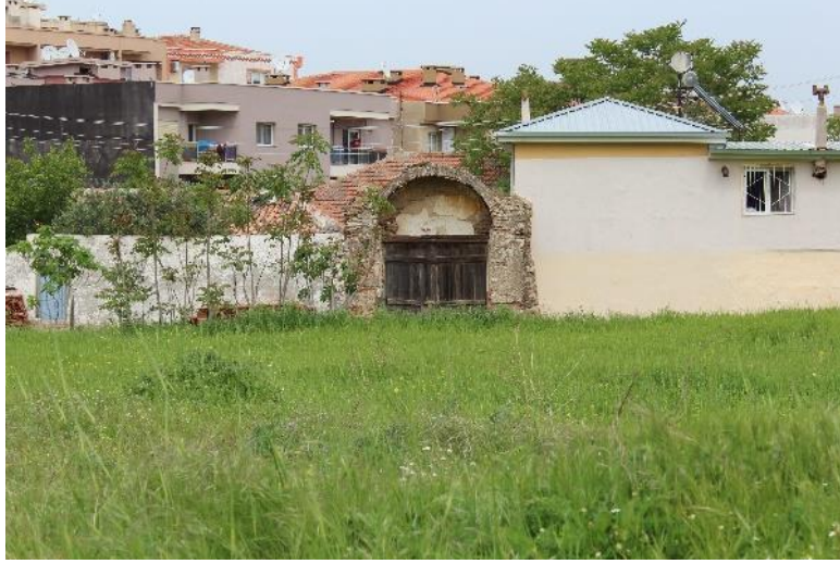
Şekil 13. Gaziemir Botanik Bahçesi (Anonim, 2021f).

İngiltere’de bahçeye ilgili çok sayıda kaynağa ulaşılrken Oxford Üniversitesi’nde Sherard tarafından kurutulmuş ve İzmir (Smyrna) ismi verilmiş 50’den fazla bölgeye özgü bitki türüne ait fotoğraflara ulaşılabilir (Anonim, 2021h).