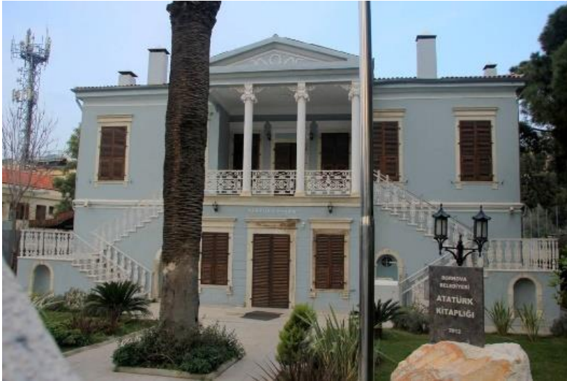
Şekil 6. Belhomme Evi, Bornova (Anonim, 2021a).