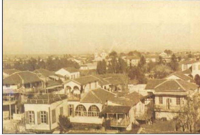
Şekil 3. Mersin kentinin doğu-kuzey yönünde görüntülenmiş bir fotoğrafı. Arkada görülen çift kuleli kilise 1944’te yıkılan Ayios Georgios Ortodoks Kilisesi (Güneş, 2010).

“Doğu Akdenizliler”in yani levantenlerin, Mersin’i, kiliseden yükselen çan seslerinin, camilerden gelen ezan seslerinin duyulduğu dama şeklinde planlı ve düzenli sokaklarıyla, Ebniye Nizamnamelerine (Yapılar Tüzüğü) uygun kesme-taş duvarlı, Marsilya kiremitli çatıları bulunan güzel ve gösterişli yapılarıyla Anadolu şehirlerinden farklı, adeta yepyeni bir kent olarak yeniden yaratmışlardır (Şekil 3), (Güneş, 2010).