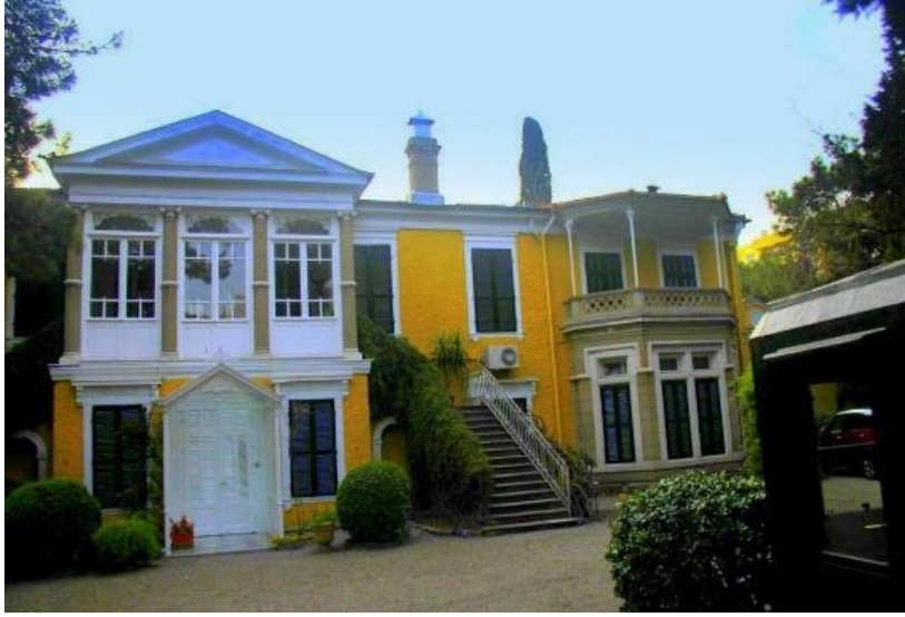
Şekil 5. Aliberti Evi, Bornova (Anonim, 2021a).

Köşkerlerin birçoğu 19. yüzyılın ilk yıllarında inşa edilmeye başlanarak, klasik denilebilecek bir stilde inşa edilmiştir. Çoğu konut yapısı Yunanistan'daki ismiyle "Orthonion" tarzında inşa edilmiştir. Korint ya da çıkma/konsüllü tasarımlar taşıyan başlıklarla belirginleştirilmiş ve Tuskana sütunları olan ilgi çekici revaçlarla klasik mimarinin bir kompozisyona sahiptirler (Basgün, 2012). Köşkerlerin mimari yapıları kadar dış dünyaya açılan kapıları olan bahçeleri de en az köşkerler kadar etkileyici ve görkemli bir kompozisyon sunmaktadır. Geniş bahçeli ve yüksek duvarlı köşker yapıları, köşker sakinlerinin geldikleri ülkelerdeki konakların ve şatoların bahçelerinden esinlenerek tasarlandığı görülmektedir. İzmir'in Bornova semtinde yer alan ve bahsi geçen mimari özellikleri barındıran Ailberti evi, Belhomme evi ve Edward Withall evi bunlara örnek olarak gösterilebilir (Şekil 5,6 ve 7).