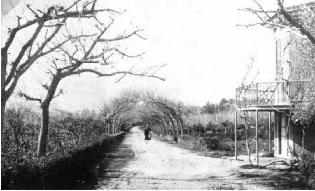
Şekil 11. Hasanağa Bahçesi promenadeı, Buca (Anonim, 2021e).

5.1. Hasanağa Bahçesi: 107.615 m 2 'lik alana yayılan Hasanağa Bahçesi'nin ilk sahibi İtalyan Levanten iş adamı Aliotti'dir (İzmir Kültür ve Turizm Dergisi, 2009). Buca'da bulunan, İtalyan asıllı Levanten iş adamı Aliotti'nin vefatı üzerine, bahçenin bulunduğu mülk ve arazi varisleri tarafından satılığa çıkarılmış ve 1926 yılında Ödemiş eşrafından Sarıgöllü Hasan Ağa tarafından satın alınmıştır ancak 1930'lu yılların başlarında sigortalı olan köşk yanmıştır. Bahçe ise, Hasan Ağa ailesinin mülkiyetinde bulunduğu sürede halka açık tutulmuş, Buca'lılar için bir mesire yeri olarak kullanılmış ve Hasan Ağa Bahçesi olarak adlandırılmıştır (İİKTM, 2017), (Şekil 11).