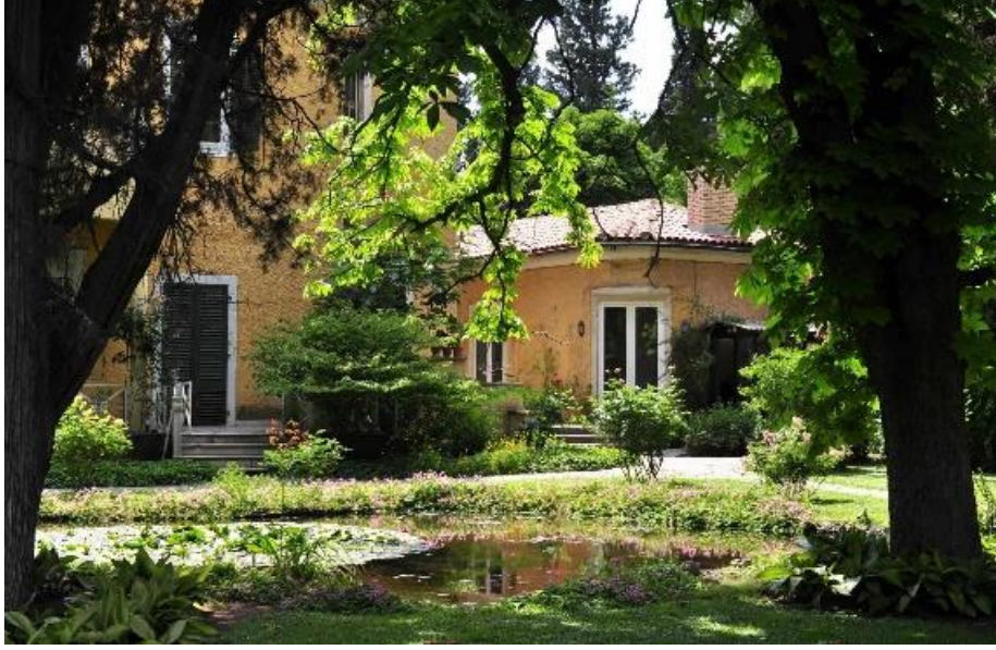
Şekil 10. E. Whittall Köşkü, Bornova (Anonim, 2021d).

Levanten bahçelerinin tasarımında eski Yunan bahçe sanatı ve Rönesans bahçe sanatının etkileri görülmektedir. Heykel ve bahçe süslemelerin yoğun kullanımı bu duruma kanıt niteliği taşımaktadır. Doğal taş, ahşap ve işlenmiş toprak temel materyalleri oluşturmaktadır. Bu materyallerin yanında eğrelti ve doğal sarmaşık türleri kullanılarak bahçeyi yapaylıktan uzaklaştırmak amaçlanmıştır.