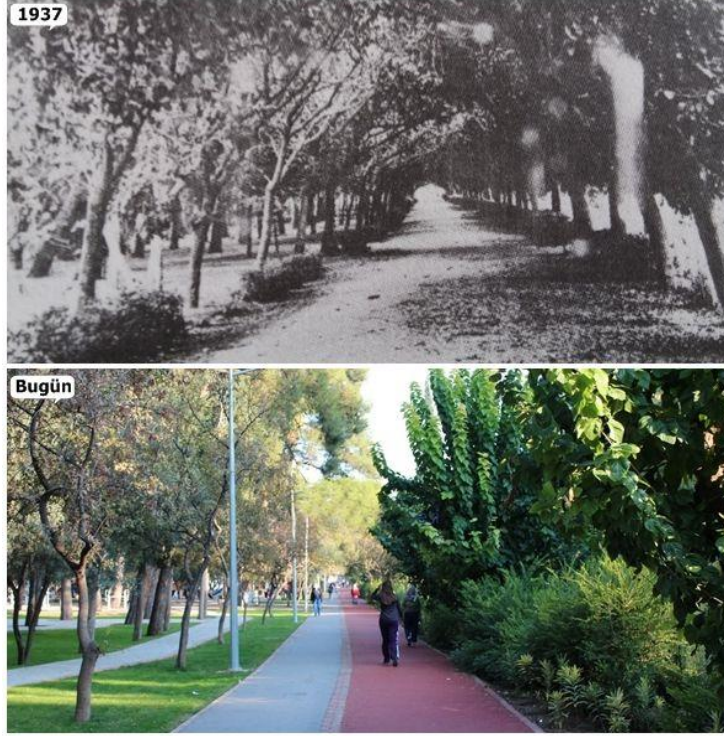
Şekil 12. Hasanağa Bahçesinin geçmişteki ve günümüzdeki kullanımı, Buca (Anonim, 2021e).

Bahçedeki, çizgisel dolaşım aksları, doğal malzemedan yapay düzenlemeler veya yapay malzemedan doğal görünüm arayışları Latin-Avrupa anlayışın yansımaları olarak irdelenebilir. Benzer türde peyzaj tasarımı yaklaşımına İstanbul Emirgan korusunda rastlanmaktadır. Aliotti'nin bu geniş araziye doğal çevre görünümünde bir hayvanat bahçesi haline getirdiği, geyik, tavus vb. hayvanların yüksek duvarlarla çevrili bahçe içinde serbestçe dolaştıkları bilinmektedir (Kılıçaslan ve True, 2018).