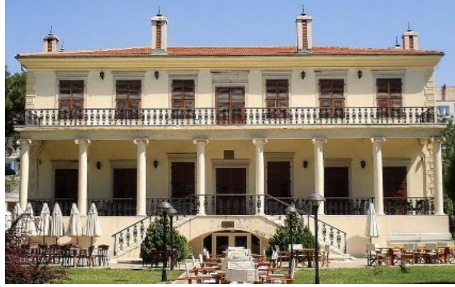
Şekil 7. E. Whittall evi, Bornova (Anonim, 2021a).