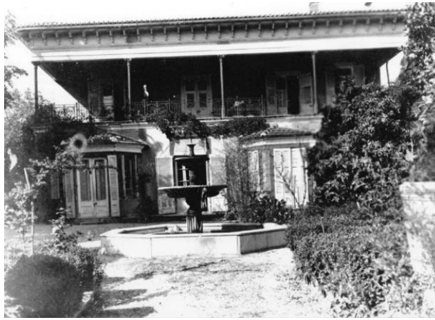
Şekil 8. Aliberti Köşkü, Buca (Anonim, 2021b).

Varlıklı Avrupalı levanten aileler, gerek köken olarak bağlı oldukları ülkelerde bulunan yapılardan esinlenerek gerekse oradaki tarzları yerel kullanıma aktararak içerisinde çok sayıda servi ağaçlarının sıra sıra dizilmiş şekilde bulunduğu geniş bahçeli konutlar meydana getirmişlerdir. Bu konutların bahçeleri, ilk yapıldığı zamandaki durumları kadar bakımlı olmasa da birçoğu günümüze kadar korunmuştur. Hem estetik hem de fonksiyonellik düşünülerek tasarlanan bahçelerde boylu ağaçlar, çalılar ve yer örtücüler bir arada kullanılmıştır (Şekil 8) (Anonim, 2021b).