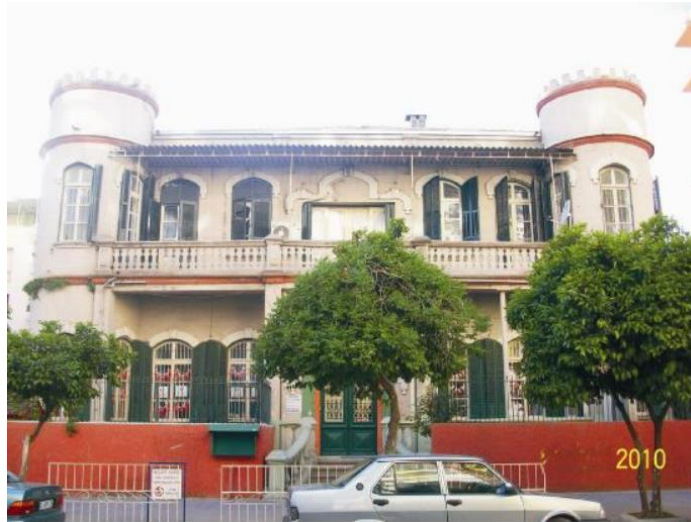
Şekil 4. Mersin’de Şaştati Evi (Güneş, 2010).

Yine Mersin’de de yapıların büyük çoğunluğunda mimari üslup, malzeme ve işlev bakımından Batılı tarzda özelliklere sahip olduğu görülmektedir. Mimari karakterlere sahip olan bu evler, özenli ve dikkatli taş işçiliklerinin gözlemlendiği yapılardır (Şekil 4). Anıtsal girişler ve kapıları, yoğun süslemeleri olan balkonlar, köşe pilasterleri, dairesel süsleme desenli rozetler ve profilli çatı pervaz çıkıntılarıyla zenginleştirildiği görülmektedir. Her iki katı da taştan yapılan bu evler, geniş bahçeler içinde bulunmalarının yanı sıra, dikkat çeken cephe düzenlemeleri, iç ve dış mekân tasarımları ile de göze çarpmaktadırlar (Güneş, 2010).