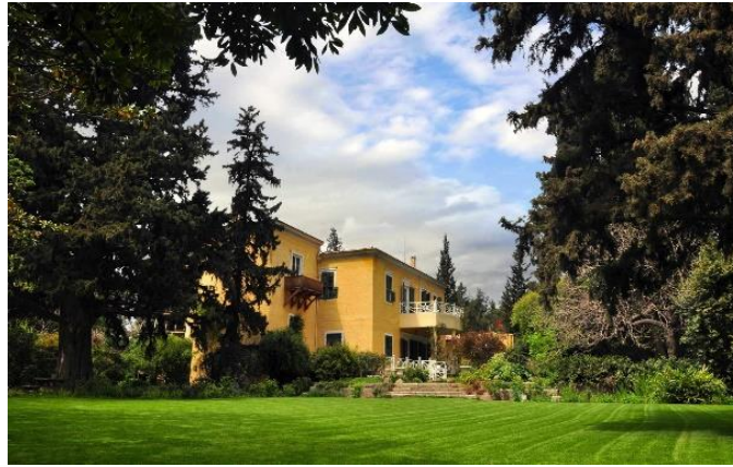
Şekil 9. E. Whittall Köşkü, Bornova (Anonim, 2021c).

İtalyan kullanıcılara ait arazilerin belirgin geometrik şekillerde bölünmüş olduğu, havuz, heykel ve gölgelendirme elemanlarının belli ana akslar üzerine yerleştirildiği tespit edilmiştir. Bu bahçelerde gözlemlenen bir diğer nitelik, yoğun dut ağacı sıraları, bazı bölümlerde ise bodur bitkilerle sınırlanmış yürüyüş aksları, promenatlardır (Kılıçaslan ve True, 2018). Doğaya ve kırsal alanlara düşkün tutumları ile tanınan İngiliz topluluğun bahçelerinde ise, doğal yapının mümkün olduğunca korunduğu (Şekil 9), arazi içinde ormansı bir hava yaratan, belli geometrilere oturmayan bir anlayışla kurgulanmış koruluk ve ağaç dizileri ön plandadır (Akkurt, 2004).