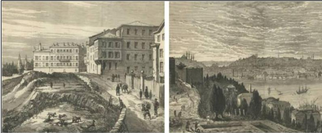
Şekil 1. Tepebaşı Konakları Ve Haliç Manzarası (Karagünlü, 2015)

Dönemde, İstanbul'da yaşayan levantenlerin, şehrin sosyo-kültürel yaşamına getirdikleri değişikliklere örnek olarak; Venedik festivallerinin bir benzeri olan Galata festivalleri ve Galata'nın sokaklarında yapılan maskeli eğlenceler gösterilebilmektedir (Ünlü, 2004). Pera'da bulunan mevcut yapı mirası; nitelikli yapıların çoğunluğunun bölgede yaşayan Levantenlere ait olması nedeniyle kentin bir yüzyıldır değişmekte olan çehresine farklı bir mimari üslup sağlamıştır (Şekil 1).